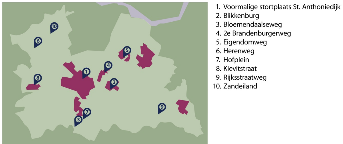
Figuur 2 Geselecteerde nazorglocaties in Utrecht voor dossieronderzoek

Figuur 2 laat zien waar de geselecteerde nazorglocaties zich bevinden in de provincie Utrecht.