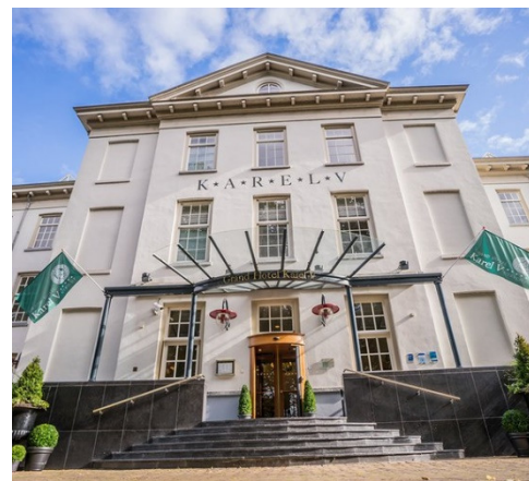
Foto: Karel V in Utrecht

Betaling dient vóór te geschieden. De factuur ontvangt u samen met uw bevestiging en de routebeschrijving.