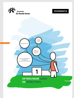
'Spreekbriefje' voor de raad